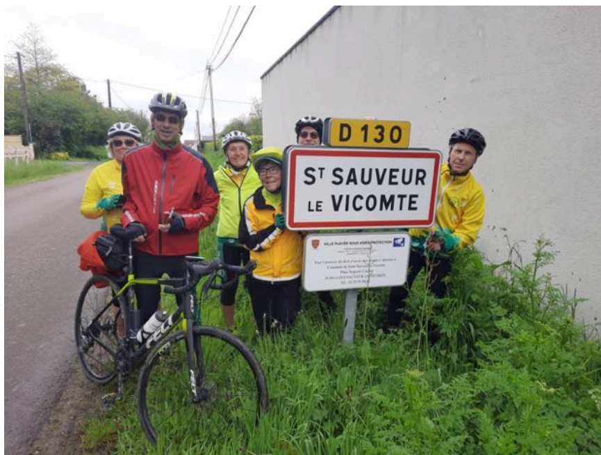
Photo traditionnelle devant la pancarte

Nous arrivons à St Sauveur le Vicomte. C'est un BPF.