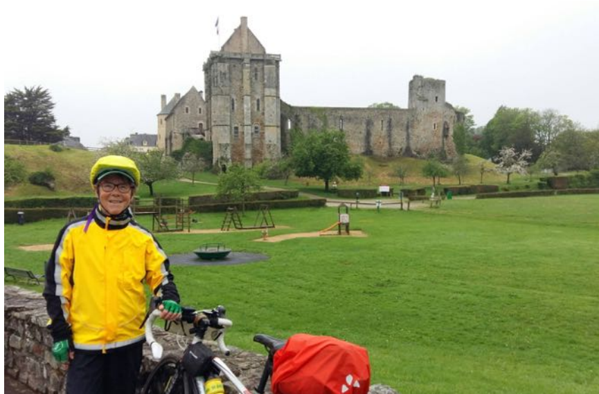
Arrêt photo devant le château

Visite de la chapelle de l'abbaye et photo devant l'abbaye.