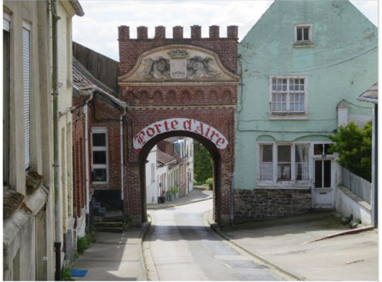
Porte d'Aire, à Cassel