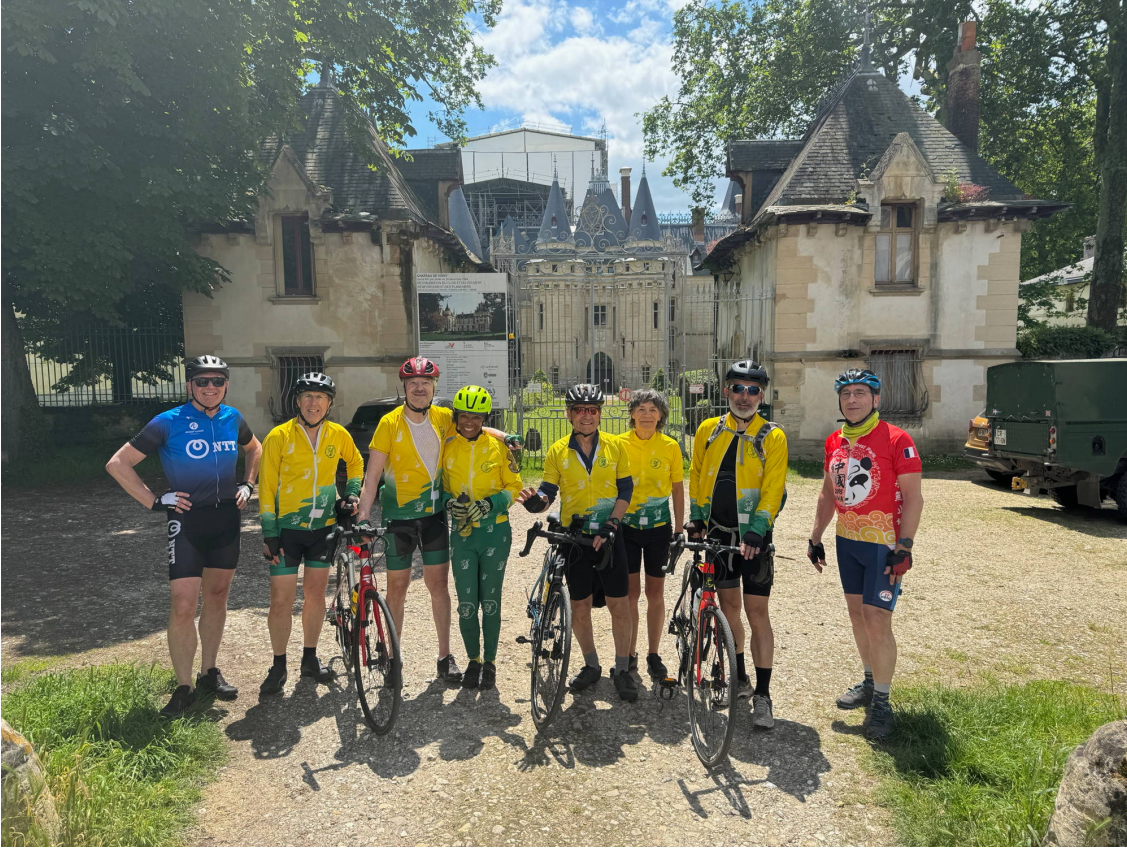
Château de Vigny

Pas de commerce ouvert à Vigny, sauf un restaurant où nous ne voulons pas perturber la quiétude des personnes à table. Nous prendrons une photo de groupe devant le château en cours de restauration.