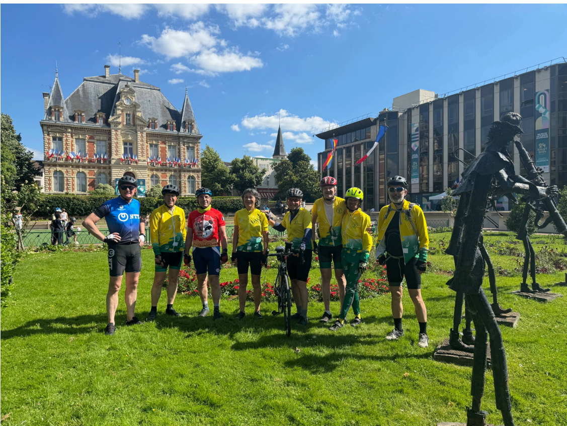
Photo avec le sourire à l'arrivée devant la mairie de Rueil

Il ne reste plus que 45 kilomètres avec juste une montée pour arriver à Courdimanche puis le retour sera descente et plat pour une fin facile.