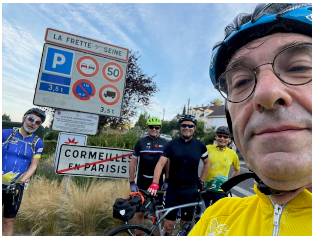
Photo du départ décalé à Cormeilles en Parisis